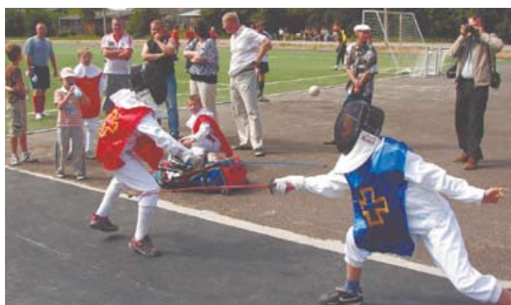
Показательные выступления арамильских «мушкетеров»