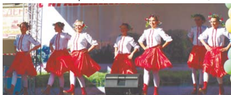
На сцене шло веселое представление