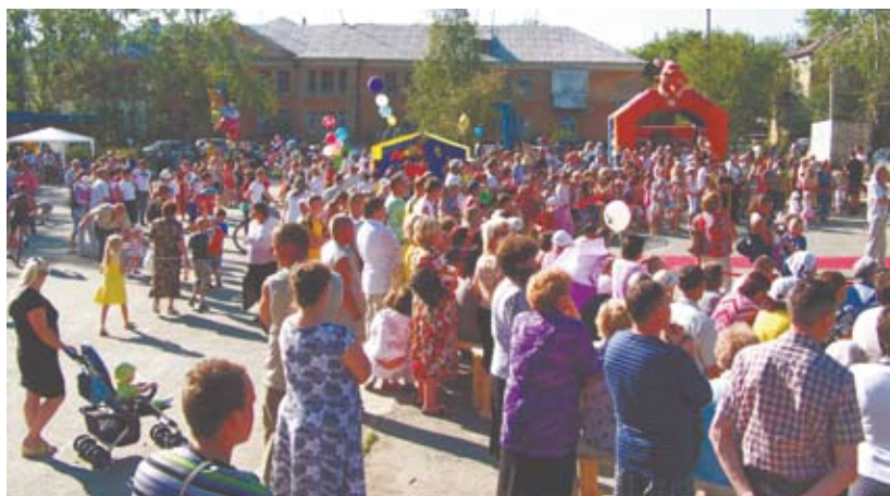
Арамильцы пришли отпраздновать юбилей родного города