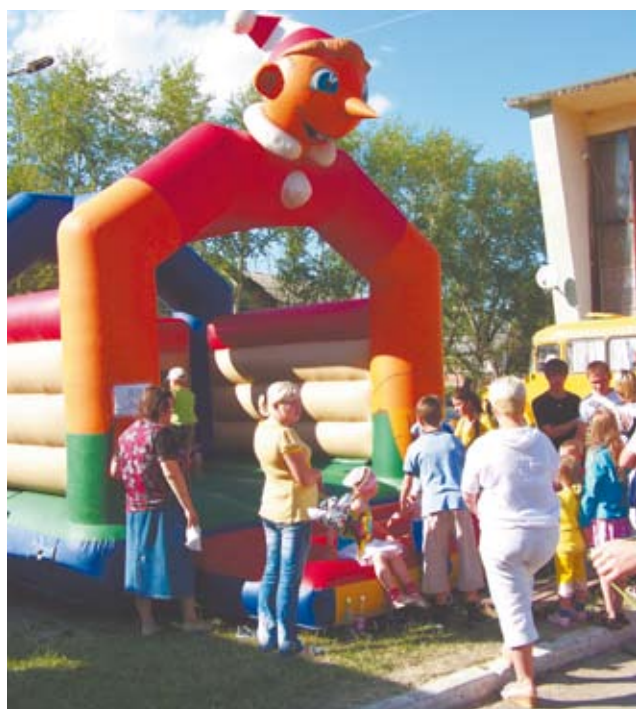
Аттракционы для детей не пустовали