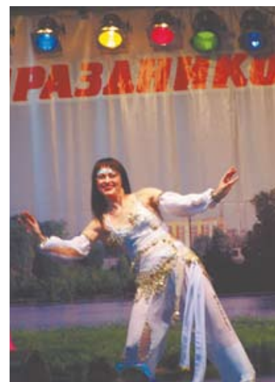
Восточный танец привлек внимание зрителей