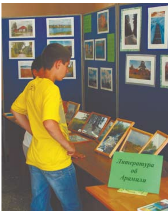
На первом этаже Дворца культуры проходили выставки, посвященные Дню города