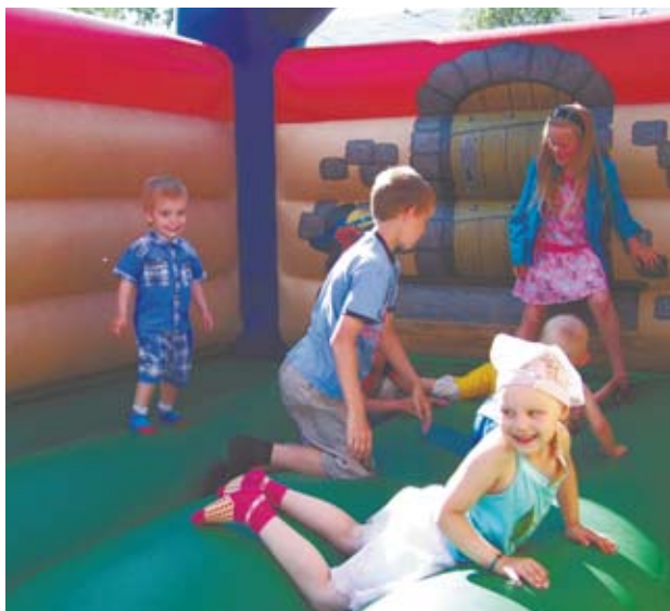
Самым большим праздником День города стал для маленьких арамильцев