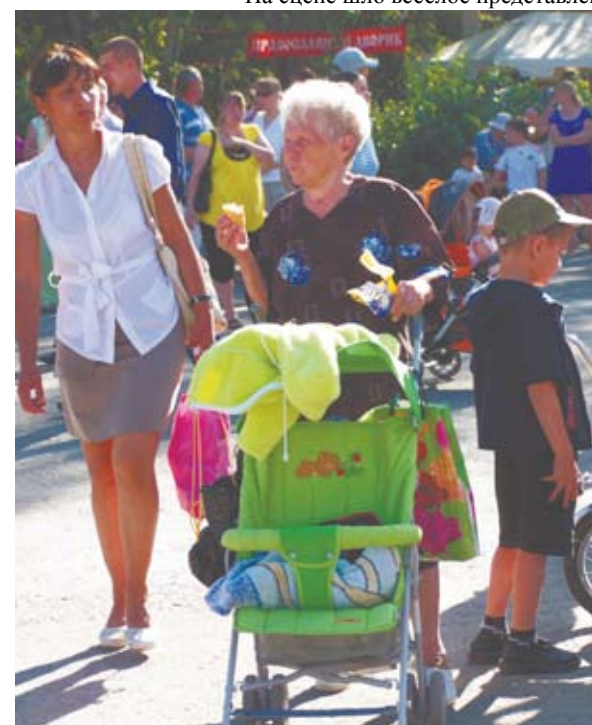
Праздник пришелся по душе арамильцам любого возраста