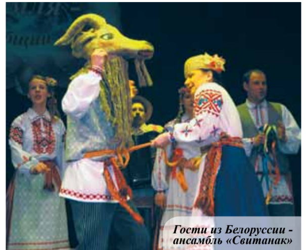
Гости из Белоруссии - ансамбль «Свитанак»