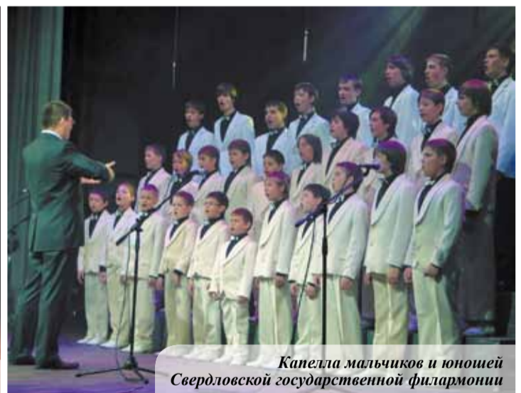
Капелла мальчиков и юношей Свердловской государственной филармонии