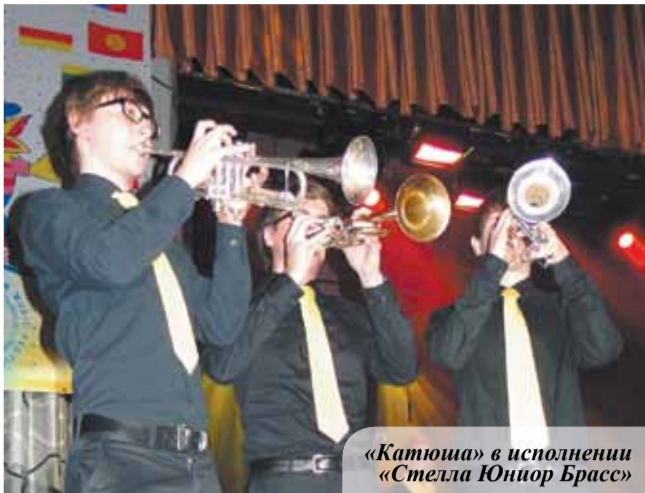
«Катюша» в исполнении «Стелла Юниор Брасс»