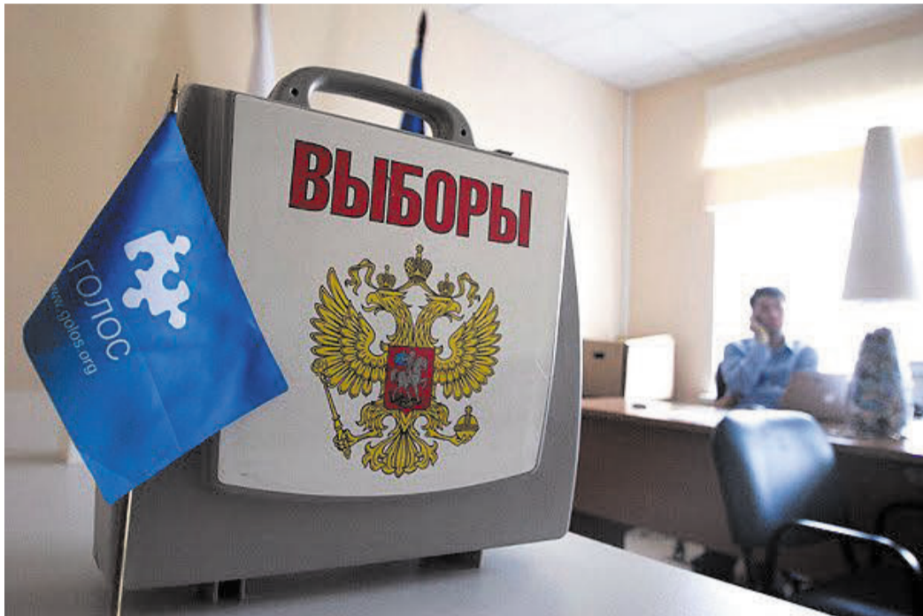
В центре внимания