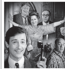
16.00 Х/Ф «ГАРАЖ» 18.00 НОВОСТИ 18.15 Т/С «РОЖДЕННАЯ РЕВОЛЮЦИЕЙ»