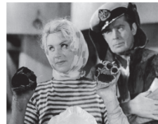
16.40 Х/Ф «СВАДЬБА В МАЛИНОВКЕ» 18.30 СЕЙЧАС 18.40 Х/Ф «СИБИРСКИЙ ЦИРЮЛЬНИК»