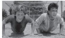
00.30 Х/Ф «КОШМАР НА УЛИЦЕ ВЯЗОВ - 2. МЕСТЬ ФРЕДДИ» (18+)