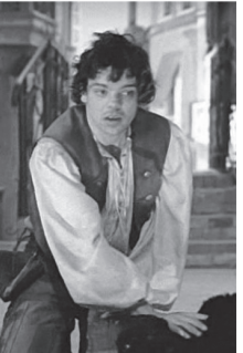
7.40 Х/Ф «ПРИКЛЮЧЕНИЯ БУРАТИНО»