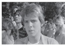
02.25 Т/С «ДЖОУИ» (16+) 02.55 Т/С «ДАВАЙ ЕЩЕ, ТЭД» (16+)

6.00 МУЛЬТФИЛЬМЫ 8.00 ПАРАЛЛЕЛЬНЫЙ МИР 11.00 Д/С «ТВОЙ МИР»