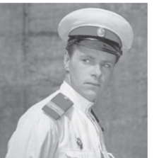
9.50 Т/С «РОЖДЕННАЯ РЕВОЛЮЦИЕЙ»