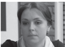
18.00 КРИВОЕ ЗЕРКАЛО. ТЕАТР ЕВГЕНИЯ ПЕТРОСЯНА (16+)