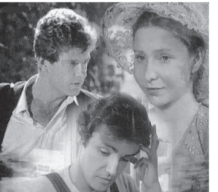
03.35 Х/Ф «ЕСЛИ ТЫ ПРАВ...»