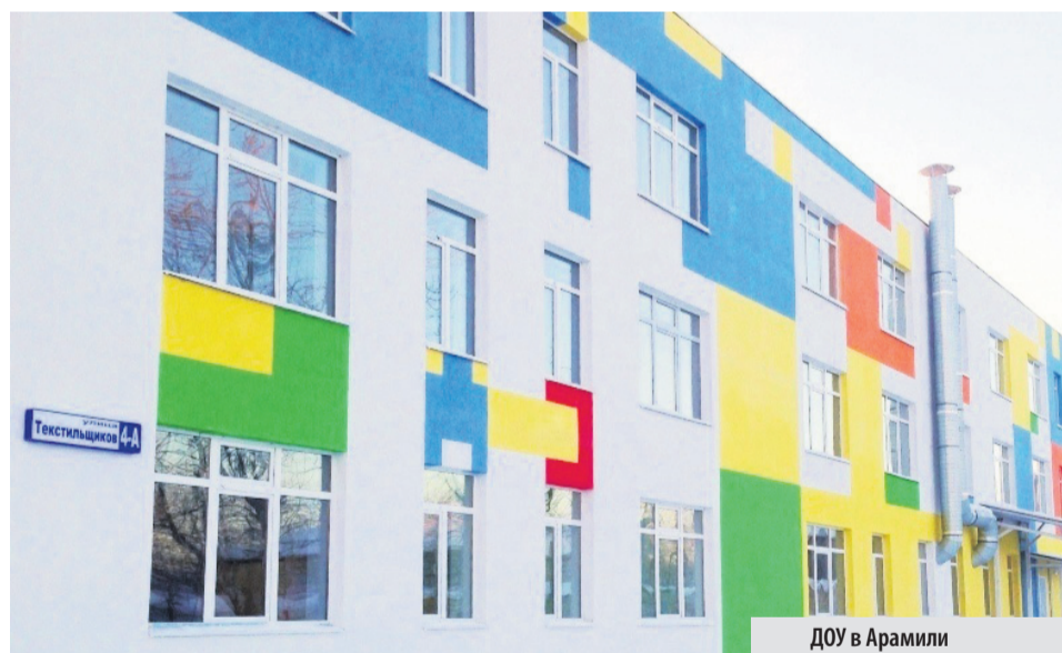
ДОУ в Арамили

«Согласно требованиям, здания должны быть вписаны в архитектурный ансамбль квартала. Нам хотелось сделать наши детские сады особенными, привнести позитив, подчеркнуть индивидуальность и придать особый стиль. В своей работе мы использовали психологию восприятия цвета и «раскрасили» наши объекты согласно рекомендациям психологов. Отдел архитектуры и градостроительства положительно воспринял нашу идею. Сейчас у нас появились последователи – другие строители тоже преобразуют фасады дошкольных учреждений с помощью цвета, что позволяет создать определенное настроение сотрудникам и воспитанникам детских садов», - рассказали в СК «ГЕН СТРОЙУРАЛ».