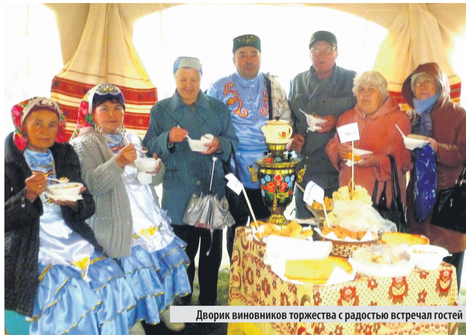
Дворик виновников торжества с радостью встречал гостей

На празднике в этот раз было всего три национальных дво-