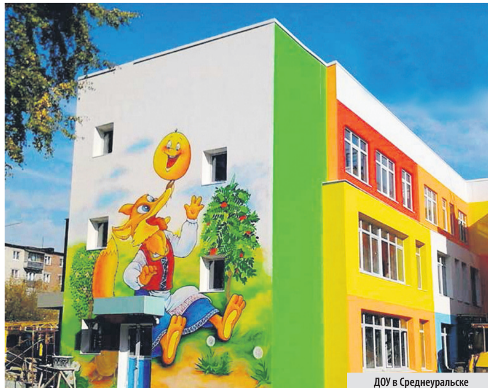
ДОУ в Среднеуральске