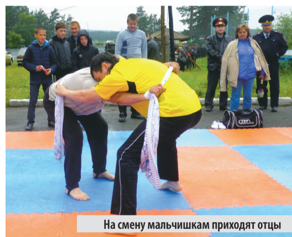
На смену мальчишкам приходят отцы

рика – татарский, армянский и таджикский. Каждый из них был полон национальных угощений, предоставил возможность познакомиться со своей национальной культурой и традициями. Весь этот день в поселке Светлый был пронизан радостью и дружелюбными улыбками. Народы разных национальностей и вероисповеданий, живущие в Арамильском городском округе, отмечали в этот день настоящий праздник единения и взаимопонимания. Пришедшие на сабантуй получили не только массу положительных эмоций, но и отведали множество национальных блюд. Каждый шатер встречал своих гостей пловом, шашлыками и вареным мясом.