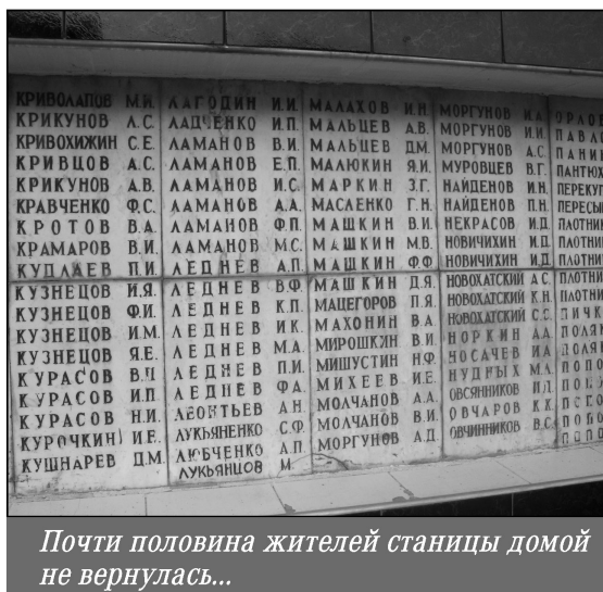
Почти половина жителей станицы домой не вернулась...