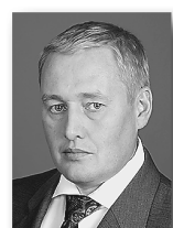
Андрей Альшевских, депутат Госдумы РФ:

«У нас большие долги по программе предоставления жилья детям-сиротам, около трёх тысяч нуждающихся. Есть проблемы с финансированием газификации территорий, нужны дополнительные средства на строительство спортивных сооружений около школ. Проблем много, но мы надеемся на дополнительные средства из федерального бюджета».