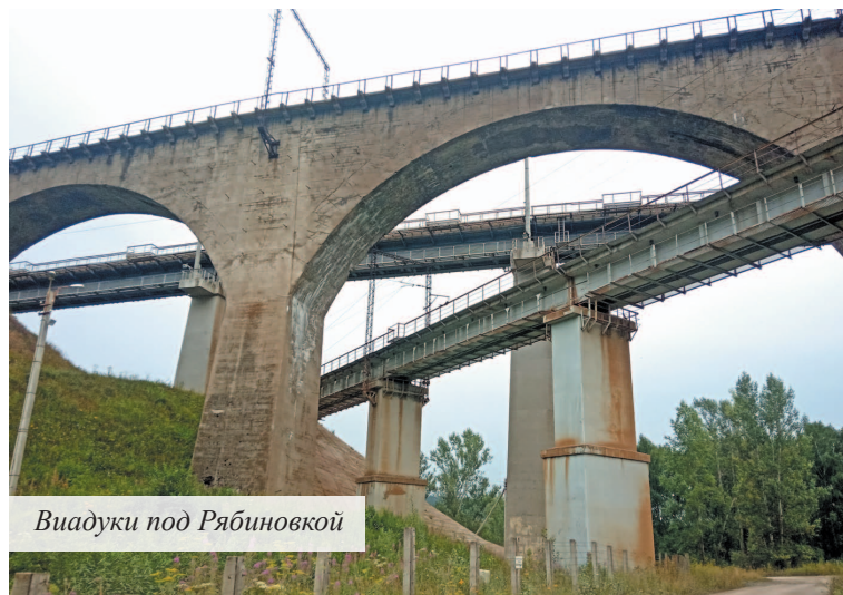
Виадуки под Рябиновкой

Цена вопроса: бесплатно. Время: любое. Дорога: 53 километра до города Полевской (час в пути) + 20 километров до Глубоченского пруда + 7 километров до села Косой Брод (10 минут езды) + 15 километров до Азов-горы (20 минут автомобильного хода).