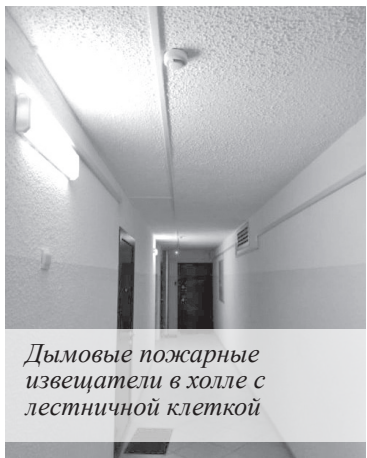
Дымовые пожарные извещатели в холле с лестничной клеткой

Важно знать, что эти требования относятся к сданным в эксплуатацию с 2003 года многоквартирным домам, а также новостроящимся объектам, в проектную рабочую документацию которых должны быть заложены работы по монтажу автоматических систем сигнализации о пожаре.