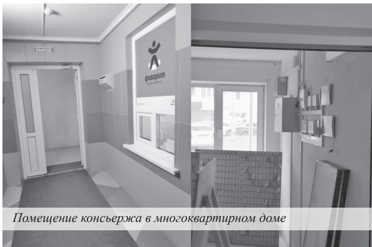
Помещение консьержа в многоквартирном доме

В прихожих/передних квартир, в технических помещениях и местах общего использования жилых зданий, чья высота превышает 28