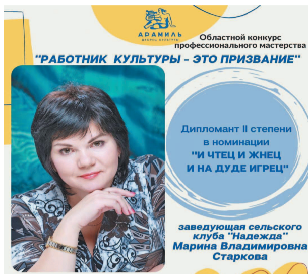
Областной конкурс профессионального мастерства "РАБОТНИК КУЛЬТУРЫ - ЭТО ПРИЗВАНИЕ"

Дипломант II степени в номинации "И ЧТЕЦ И ЖНЕЦ И НА ДУДЕ ИГРЕЦ"