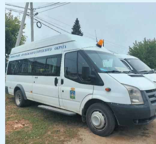
График движения автобуса на избирательные участки в День голосования, 11 сентября:

Улицы: Авиационная, Демьяна Бедного, Гарнизон № 3-4, Колхозная, Максима Горького, Мичурина, Набережная, Нагорная, Народной Воли, Новоселов, Пролетарская, Рабочая: с № 131 до конца улицы и с № 130 до конца улицы, Садовая: с № 23 до конца улицы и с № 18 до конца улицы, Сосновая, Степана Разина с № 19 до конца улицы, с № 16 до конца улицы, Строителей, Химиков, Переулки: Дорожный, Исетский, Молодежный, Прибрежный, Светлый, Северный.