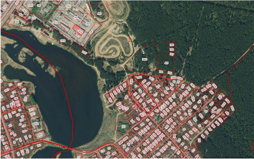
Схема размещения земельного участка

Приложение № 2 к Требованиям к разработке градостроительной документации по планировке территории линейного объекта «Участок улично-дорожной сети от улицы Новоселов до улицы Нагорной в городе Арамиле с организацией проезда к земельному участку с кадастровым номером 66:33:0101002:429»