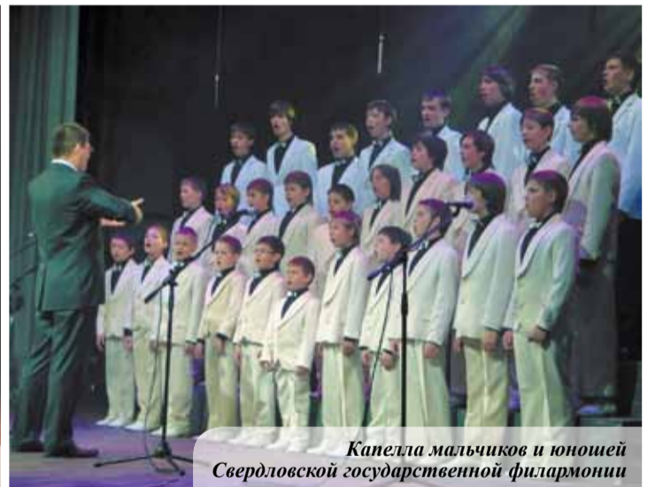
Капелла мальчиков и юношей Свердловской государственной филармонии