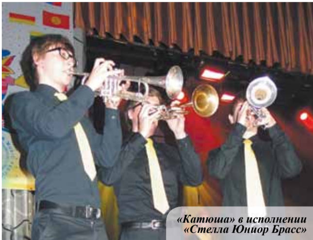
«Катюша» в исполнении «Стелла Юниор Брасс»