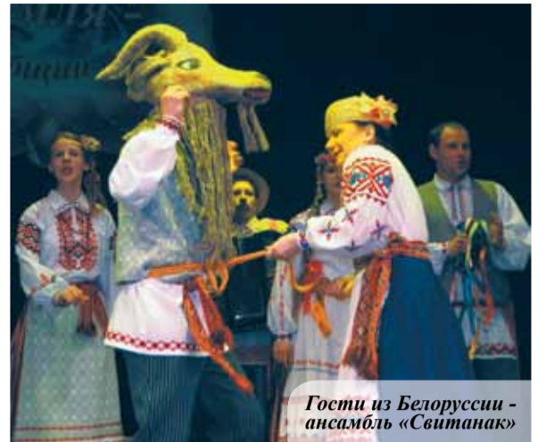
Гости из Белоруссии - ансамбль «Свитанак»