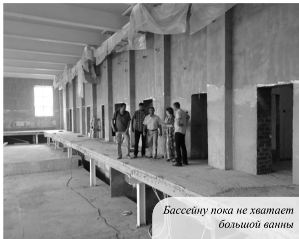
Бассейну пока не хватает большой ванны

Не останавливается также строительство бассейна. Здание уже обрело внешний вид после покраски в нежный