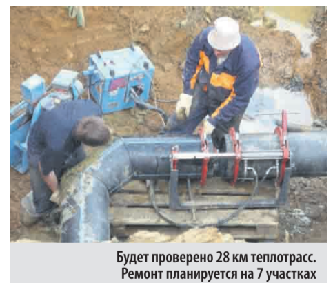
Будет проверено 28 км теплотрасс. Ремонт планируется на 7 участках

- Судить о такой эффективности пока рано, слишком мало времени прошло, чтобы говорить о каких-то ощутимых результатах. Но мы надеемся, что уменьшение числа посредников между МУП «Арамилль - Тепло» и конечным потребителем положительно скажется на нашей платежеспособности в итоге. Пользуясь случаем, я хотел бы обратиться к жителям Арамилльского городского округа с просьбой не забывать о том, что и от них зависит комфортная жизнь в родном городе. От того, на-