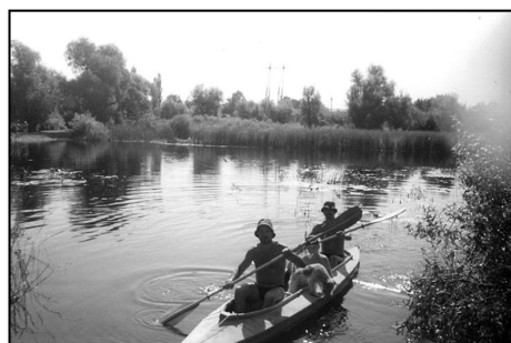
В путешествия по «тихой» воде мы нередко брали с собой детей и даже четвероногих друзей.

у бабульки, ловившей мелкую рыбешку с помощью деревянного прута с леской.