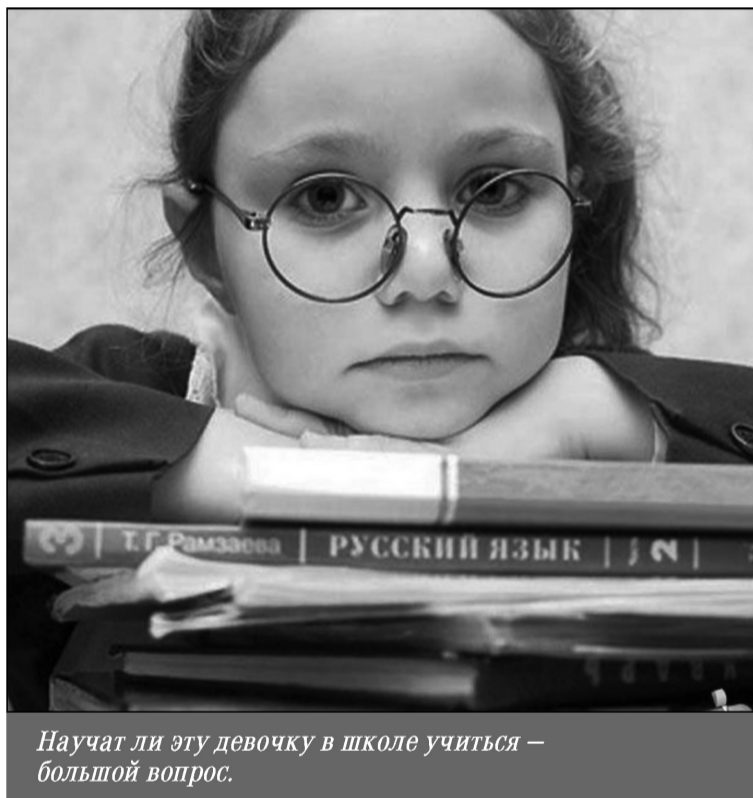
Научат ли эту девочку в школе учиться — большой вопрос.

Все так и есть. Только почему депутат Госдумы и тогда даже один из ее руководителей (потом он