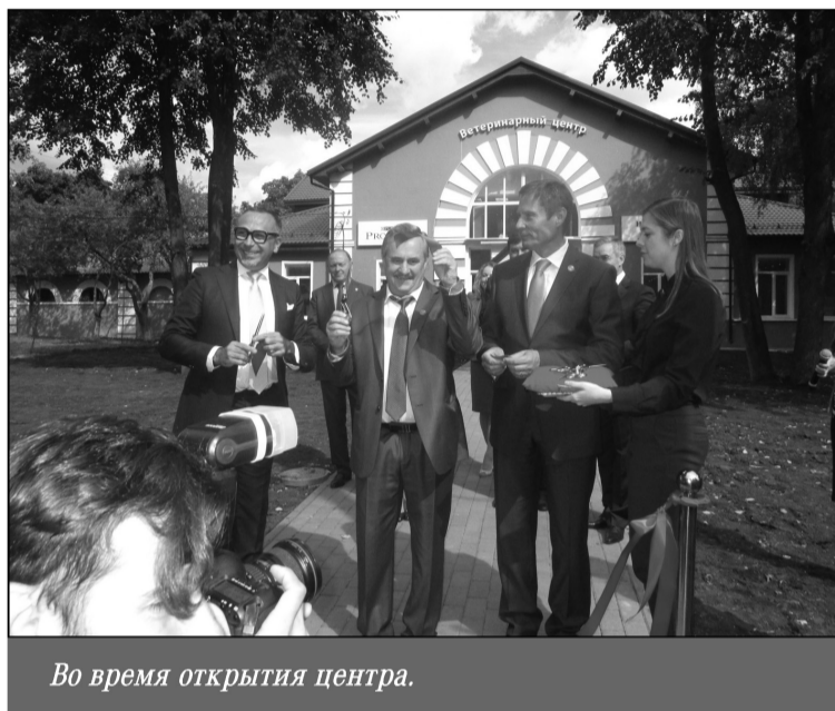
Во время открытия центра.

— Мы гордимся, что «Нестле Пурина» стала частью этого уникального проекта. В центре для нас создана уникальная возможность делиться нашим вековым опытом. Как эксперт в области питания и ухода за домашними животными, «Пурина» активно поддерживает инициативы, направленные на развитие ветеринарной профессии в России. Для нас особенно важно, что инновационный центр будет специализироваться на лечении домашних животных, ведь в настоящее время есть насущная потребность развивать это направление в