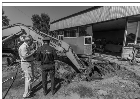
Был человек — и нет человека.

Эксперты не исключают, что провал спровоцировали подземные полости, оставшиеся