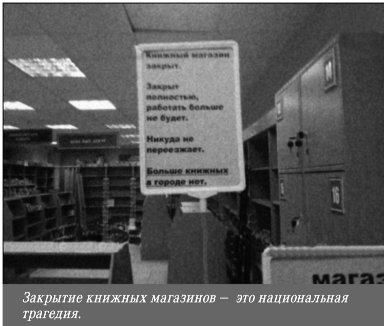
Закрытие книжных магазинов — это национальная трагедия.

В нынешних же магазинах, что чудом еще выживают, книги становятся дороги, слишком дороги, чтобы любой человек мог позволить себе покупать их! Если еще в прошлом году в специализированном