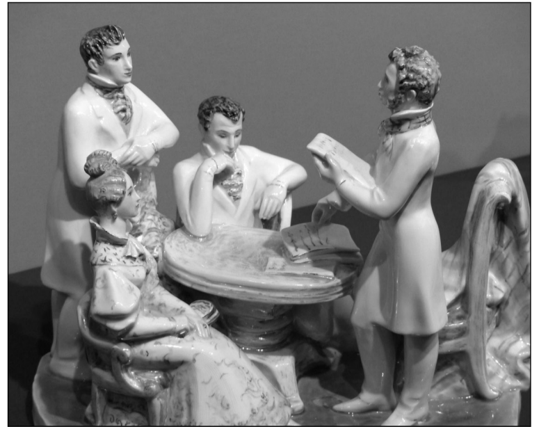
Один из экспонатов выставки: ба, знакомые все лица!

современные композиции ведущих художников Императорского фарфорового завода, посвященные писателям и литературным произведениям разных жанров. Здесь представлено многообразие авторских взглядов на литературные шедевры, продолжающие служить