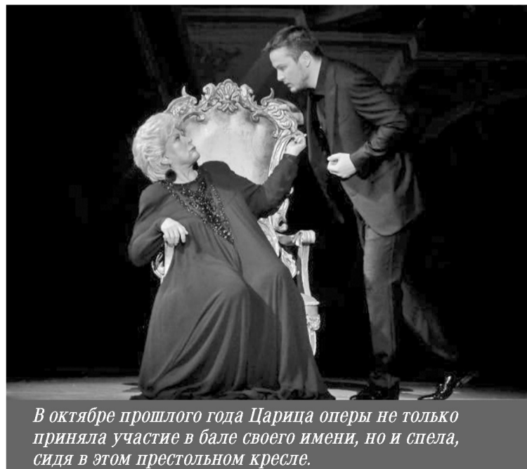
В октябре прошлого года Царица оперы не только приняла участие в бале своего имени, но и спела, сидя в этом престольном кресле.