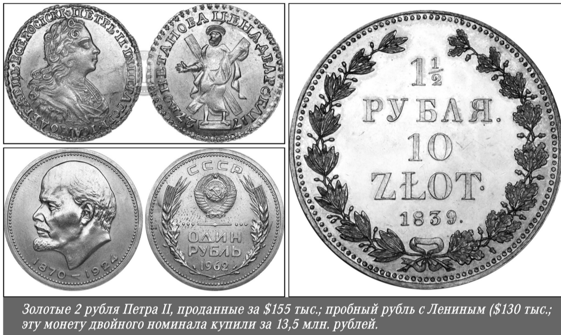
Золотые 2 рубля Петра II, проданные за $155 тыс.; пробный рубль с Лениным ($130 тыс.; эту монету двойного номинала купили за 13,5 млн. рублей).

Например, пробный рубль 1962 г. с портретом Ленина был продан на аукционе «Редкие монеты» за 130 тыс. долларов, и эта монета стала второй по стоимости советской монетой, купленной когда-либо на аукционах. Первое место занимают пробные 50 копеек 1929 г. с трактором — около