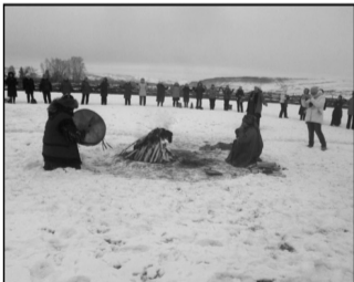
Мы «кормили» огонь, общались с духами. И наши просьбы были услышаны.