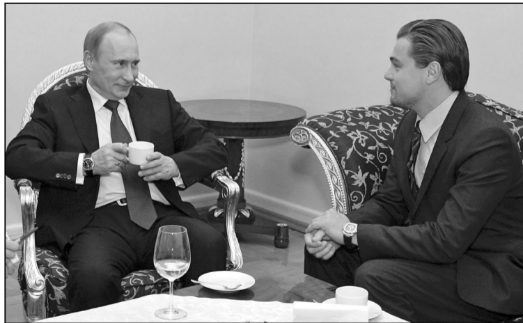
По мнению экспертов, Ди Каприо сыграет Путина лучше других.

Всемирную паутину захлестывают споры о том, кто же сыграет главную роль в первом художественном фильме о президенте России