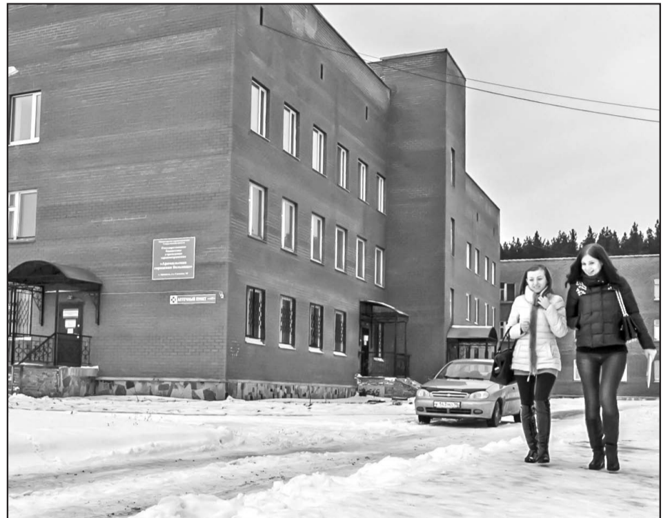
Арамилская городская больница находится по адресу: ул. Садовая, 10.

Чтобы пройти диспансеризацию, жителю Арамилского городского округа достаточно обратиться на прием к своему участковому врачу или напрямую в кабинет медицинской профилактики (с 8.00 до 15.00), где ответственный сотрудник