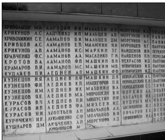
Почти половина жителей станицы домой не вернулась...