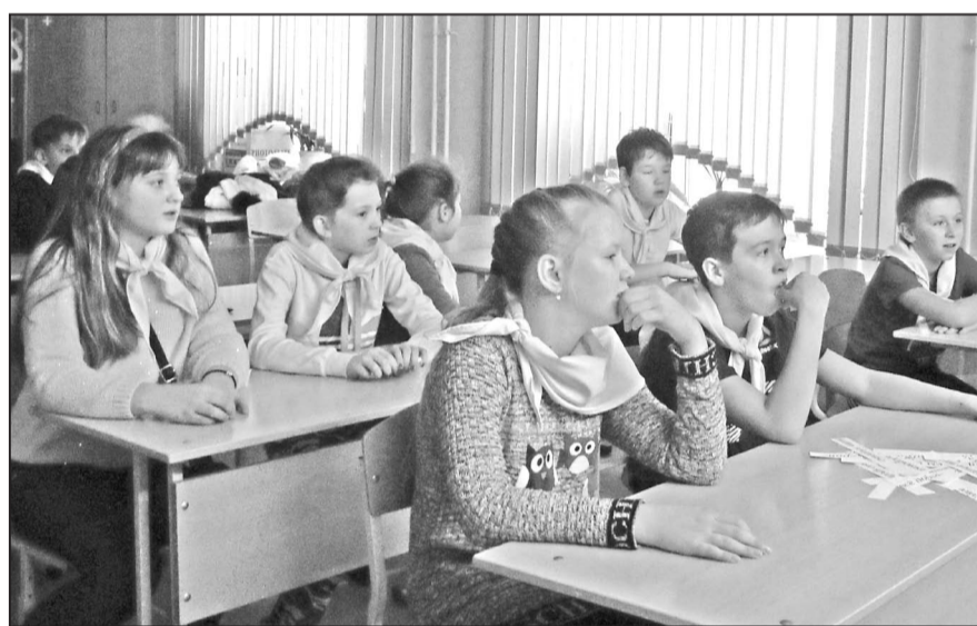
...Но и ребятишкам помладше знать о серьезнейшей болезни будет не лишним, пусть многого они пока и не понимают