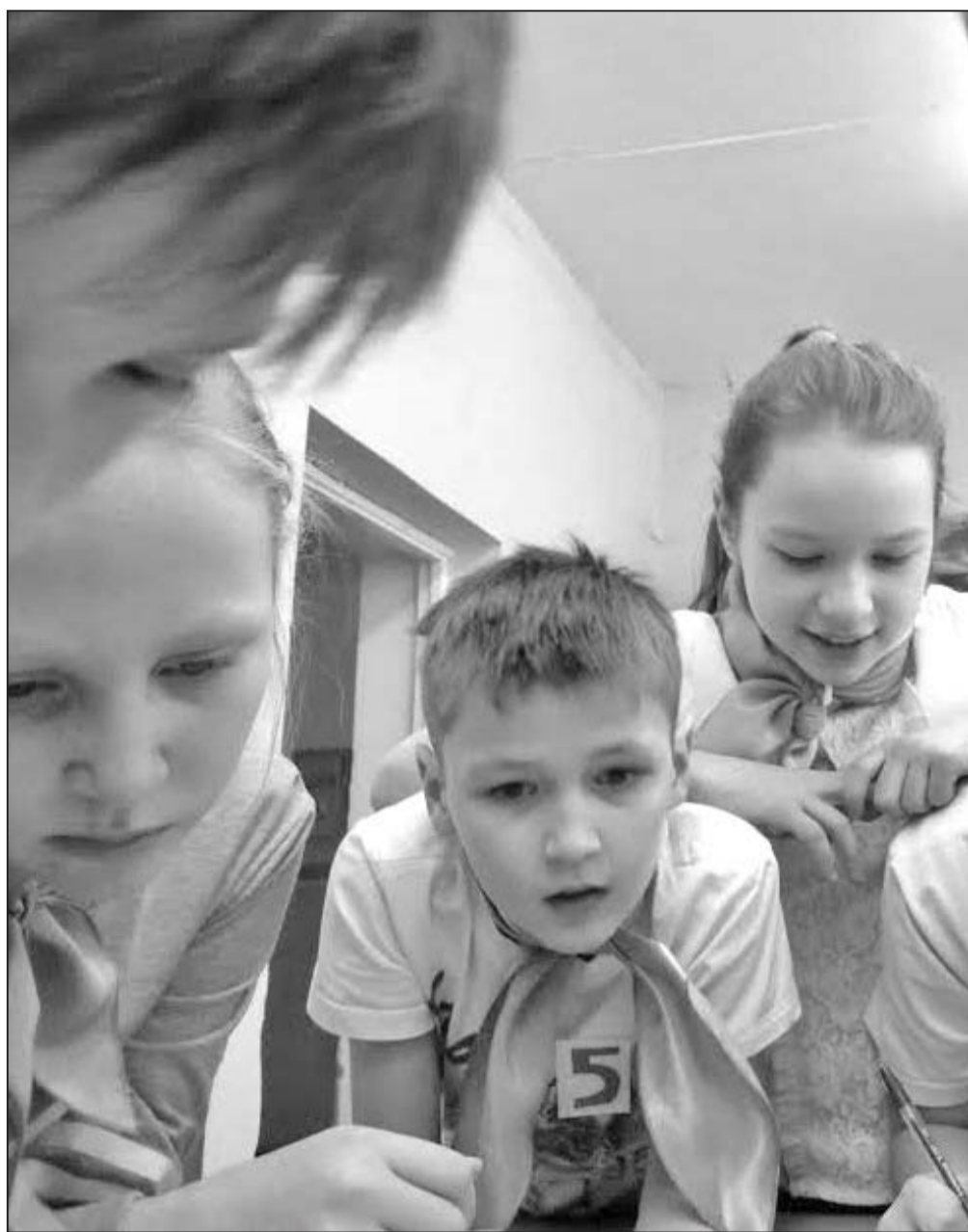
Давно известно: если детям в игровой или увлекательной форме рассказывать о проблемах или насущных темах, они лучше усваивают!