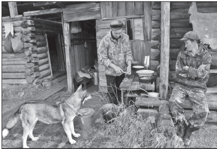
Наследники тунгусов по-прежнему живут охотой и рыбной ловлей, не избалованные бытом.