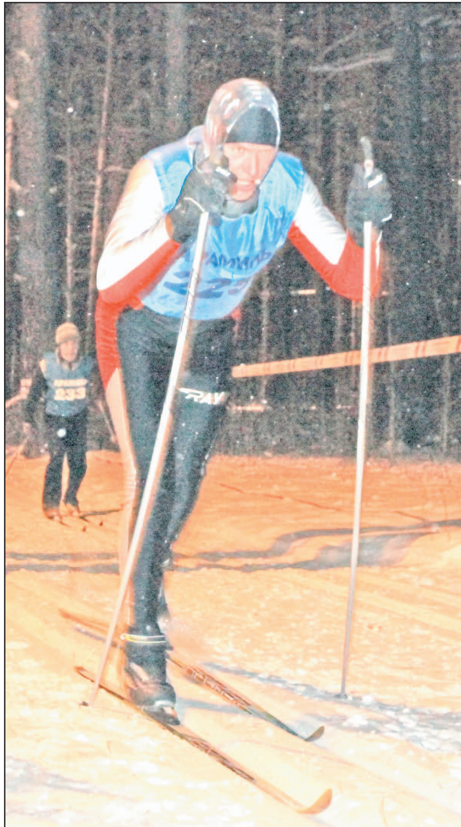
Одни «работали» на результат, стараясь добежать как можно быстрее, а другие ставили цель — главное, дойти до финиша!

Артур МАМАТОВ