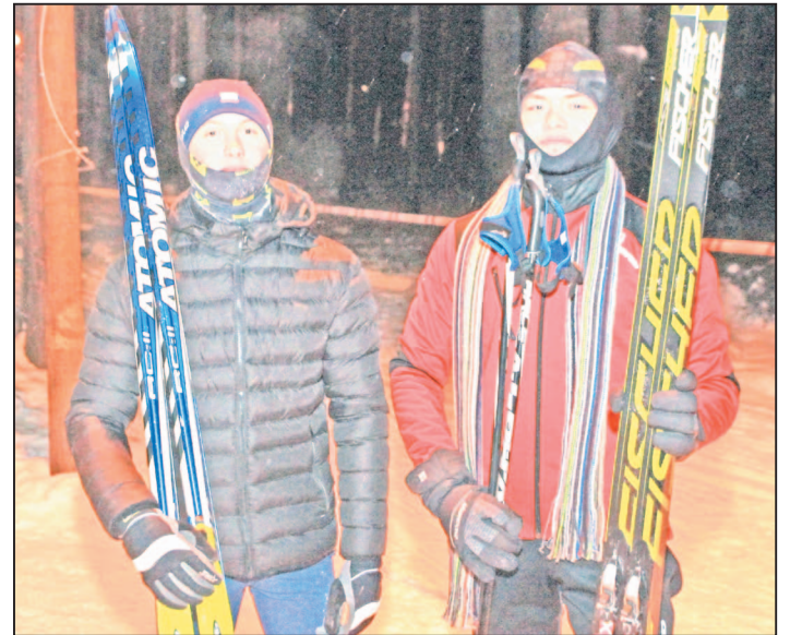
И стар, и млад пришли на открытие лыжного сезона, несмотря на мороз. И достойно пробежали дистанцию в три километра!