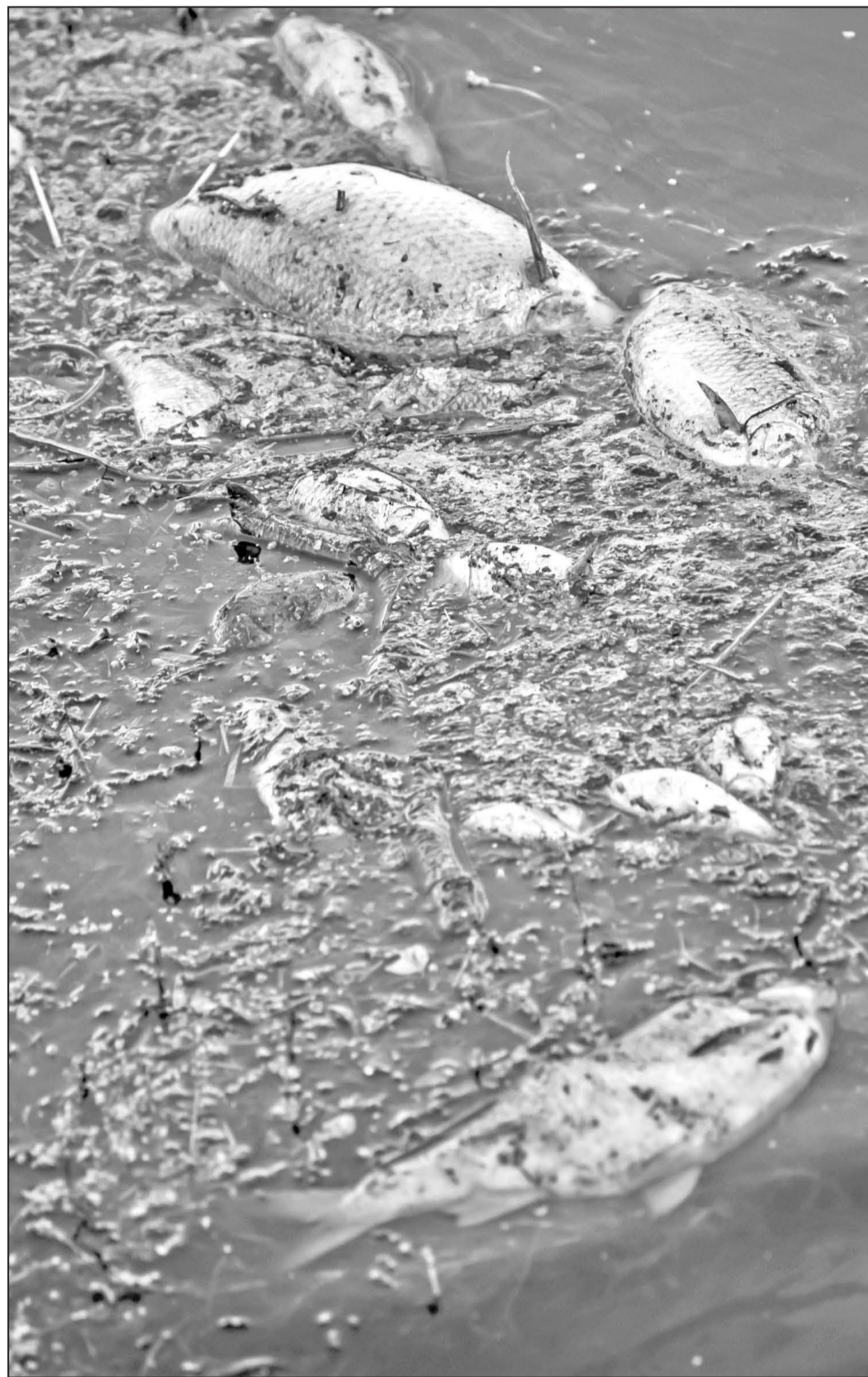
Мор рыбы летом 2015 года запомнился всем - берега пруда тогда были усыяны рыбой, погибшей в результате экологической катастрофы...

Материалы разворота подготовила Анастасия РЕУТОВА