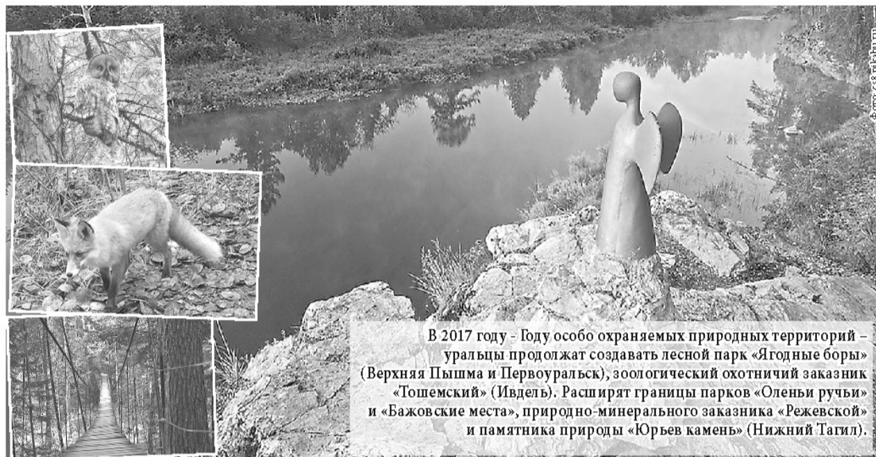
В 2017 году – Году особо охраняемых природных территорий – уральцы продолжат создавать лесной парк «Ягодные боры» (Верхняя Пышма и Первоуральск), зоологический охотничий заказник «Тошемский» (Ивдель). Расширят границы парков «Оленьи ручьи» и «Бажовские места», природно-минерального заказника «Режевской» и памятника природы «Юрьев камень» (Нижний Тагил).