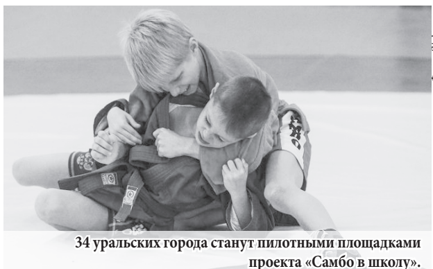
34 уральских города станут пилотными площадками проекта «Самбо в школу».