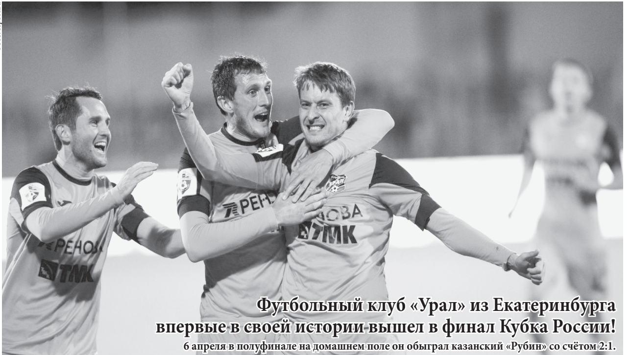
Футбольный клуб «Урал» из Екатеринбурга впервые в своей истории вышел в финал Кубка России!

6 апреля в полуфинале на домашнем поле он обыграл казанский «Рубин» со счётом 2:1.