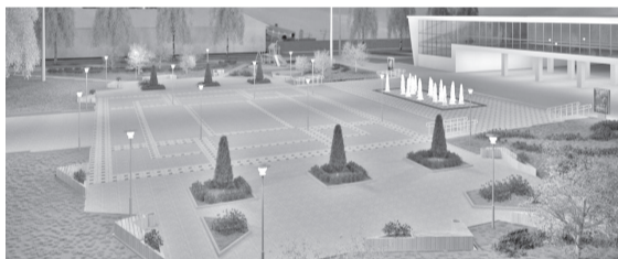
Во время масштабного опроса горожан площадь ДК набрала больше всего голосов «за». Подтвердить актуальность проекта предстоит 18 марта во время специального рейтингового голосования

— Может быть это немного громко сказано, но за всем этим стоит преобразование левого берега. Я жителям говорил еще в 2011 году: у вас на левом берегу будет гораздо красивее, чем на правом. Такова специфика: по центральной части Арамилы прохо-