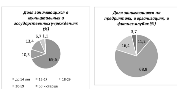
Численность занимающихся (по видам спорта)