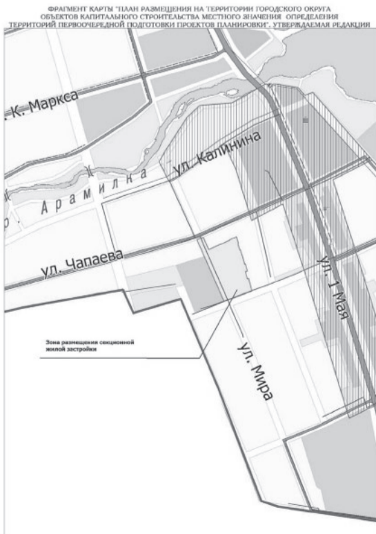
Внесение изменений в графические материалы Генерального плана Арамилского городского округа Книга 4. План размещения на территории городского округа ОКС местного значения и определения территорий подготовки проектов планировки Фрагмент карты 1.1.4