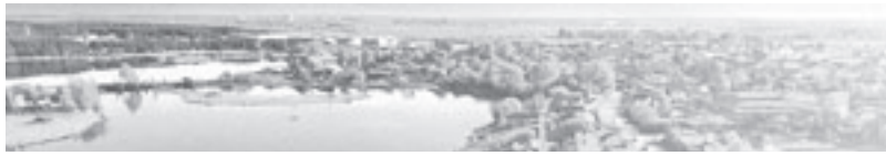
Приложение 1.2 Внесение изменений в графические материалы Генерального плана Арамилского городского округа Книга 2. План развития инженерной инфраструктуры городского округа Фрагмент карты 1.1.2