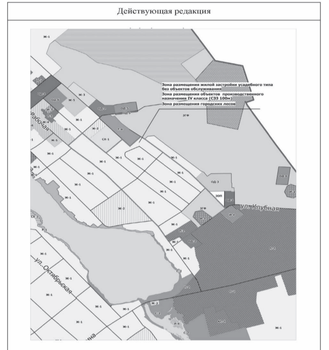
Приложение № 2