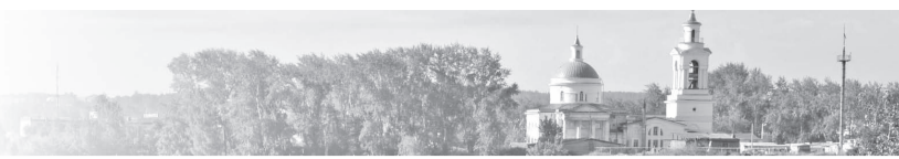
Приложение № 4

Фрагменты карты «Карта зон с особыми условиями использования территории городского округа»