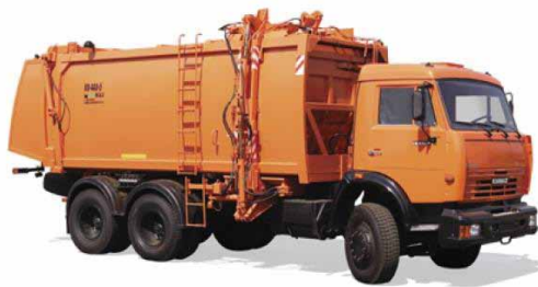
Рис. 4.22. Мусоровоз с боковой загрузкой КО-440-5 на базе шасси КАМАЗ 65115