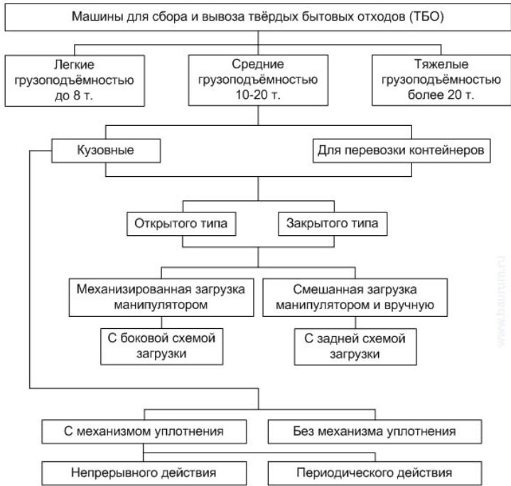
Рис. 4.19. Классификация машин для сбора и вывоза ТКО

Мусоровозы можно разбить на три основные группы: контейнерные, кузовные и транспортные. Контейнерные мусоровозы представляют собой самоходные шасси, снабженные подъемно-транспортным оборудованием. Оно позволяет поднимать с земли, устанавливать на шасси, транспортировать, а при необходимости разгружать специальные съемные контейнеры (бункеры, платформы) с различными видами отходов. Их главное достоинство – относительная простота, а также использование одного автомобиля для последовательного обслуживания нескольких контейнеров по мере накопления отходов. Самый главный недостаток – невозможность их уплотнения. Между собой упомянутые машины различаются конструкцией контейнеров и устройством погрузочно-разгрузочного механизма. Открытые контейнеры позволяют собирать любой мусор, в том числе и крупногабаритный, тогда как их закрытые разновидности рассчитаны в основном на твердые коммунальные отходы. Вместимость контейнеров колеблется от 3 до 40 м³. Подъемно-транспортное оборудование выполнено в виде портального механизма или продольно расположенной рамы, которая снабжена устройствами для перемещения и фиксации контейнеров нескольких типов.