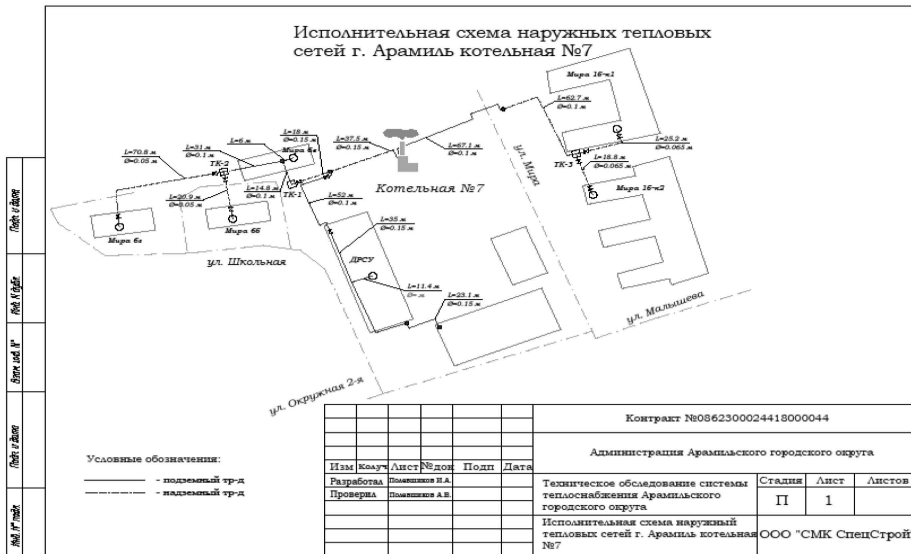
Рис. 21 – Исполнительная схема наружных тепловых сетей котельной №7