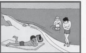
Не переохлаждайтесь и не перегревайтесь! После приема пищи заплывайте в море 1,5–2 часа! Не купайтесь при температуре воды — ниже 16 градусов и выше 22 градусов!