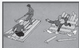
Не используйте для плавания самодельные устройства! Они могут не выдержать ваш вес и перевернуться!