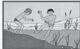
В воде избегайте вертикального положения. Не ходите по илистому и заросшему водорослями дну.