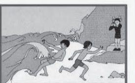
Не купайтесь в штормовую погоду! Берегитесь волн!