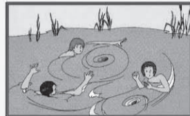
Не боритесь с сильным течением! Плывайте по течению постепенно приближаясь к берегу!