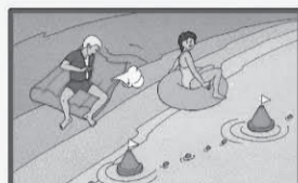
Не заплывайте далеко от берега на надувных матрацах и автомобильных камерах!