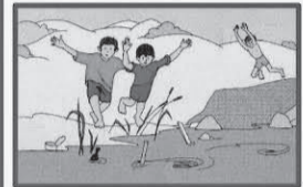
Не купайтесь у крутых обрывистых берегов с сильным течением, в заболоченных и заросших растительностью местах!