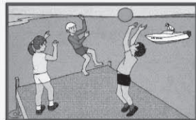
Не стойте и не играйте в тех местах, откуда можно свалиться в воду!