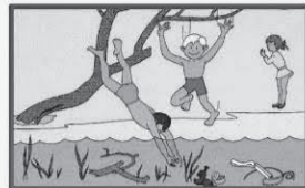
Не ныряйте в незнакомых местах! Не известно, что там может оказаться на дне!