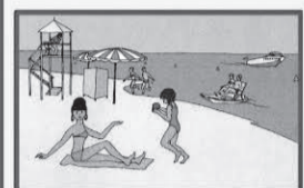
Купайтесь только в разрешенных местах, на благоустроенных пляжах!