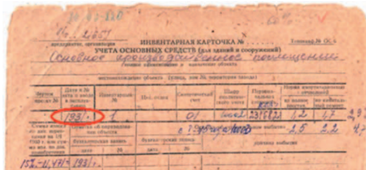
Основной производственный корпус АО «ААРЗ» (в прошлом в/ч 21651) был основан в 1931г.