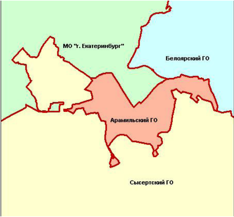
Рисунок 1.1 Местоположение Арамильского городского округа в системе расселения

Основными источниками водных ресурсов в Арамильском городском округе являются река Исеть с установленным на ней Арамильским водохранилищем и река Арамилка.