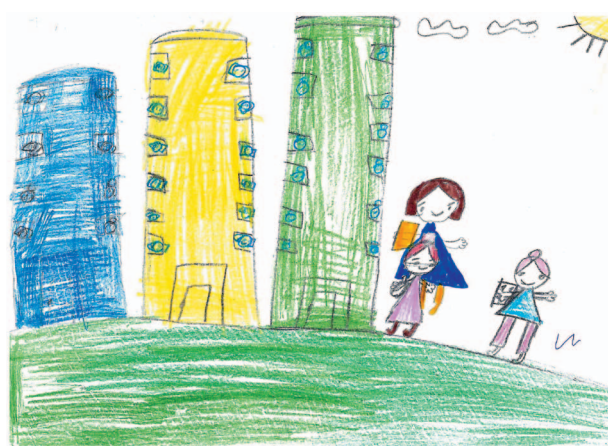
III место - Кирякова Галина.