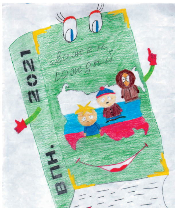
III место - Куреша Андрей.