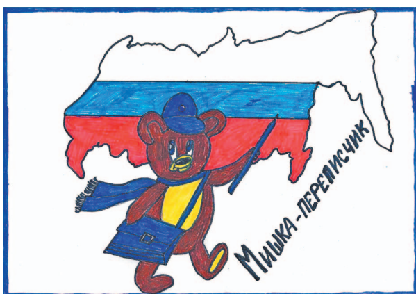
III место - Плотников Денис.