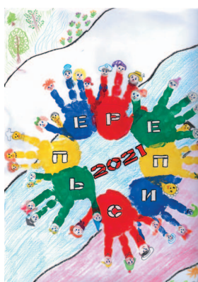
I место - Куреша Сергей;