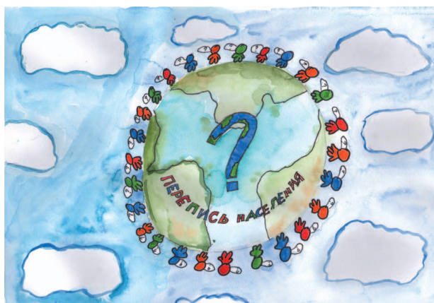
Гран-при - Сюнина Вероника;