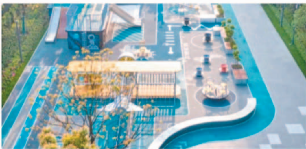
Детская площадка №17 (1495)