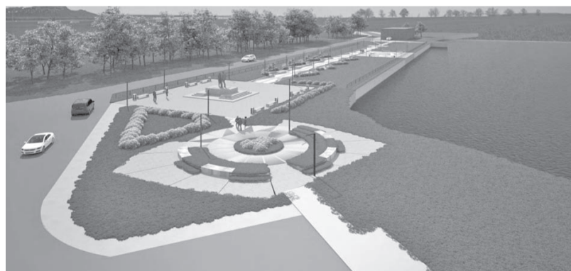
«Набережная возле памятника Шинели» (обновленный проект)

среды» за объекты благоустройства, подлежащих благоустройству в первоочередном порядке в 2024 году и на территории Арамильского городского округа.