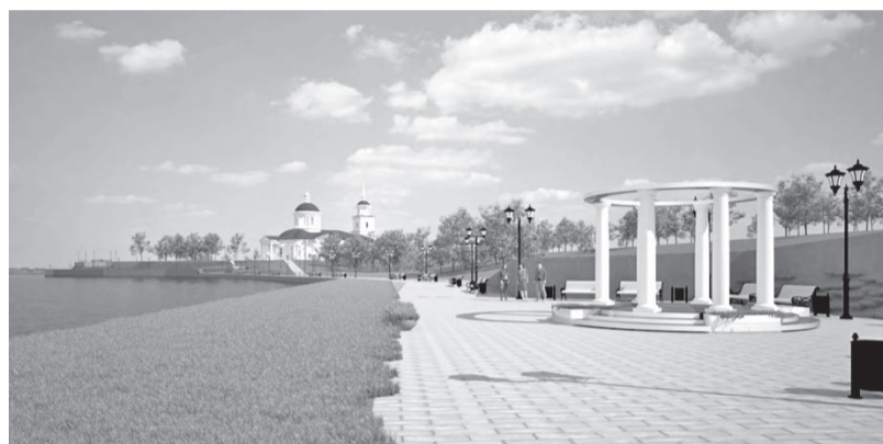
II этап I очереди Набережная р. Исеть около Храма Святой Троицы

С 15 апреля по 31 мая 2023 года пройдет рейтинговое онлайн-голосование в рамках реализации Федерального проекта «Формирование комфортной городской