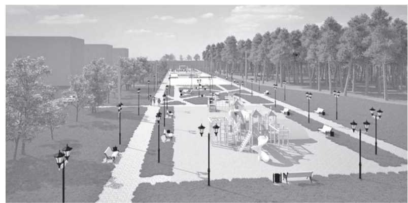
«Парк вдоль лесного массива по ул. Садовая»