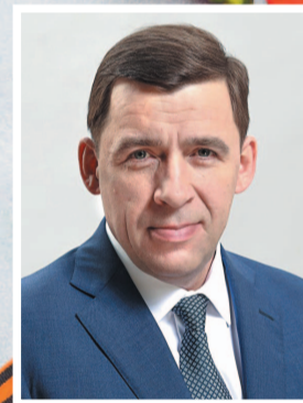
Е.В. Куйвашев, губернатор Свердловской области

Низкий поклон нашим ветеранам. Счастья, добра и благополучия всем уральцам, процветания нашей Родине!