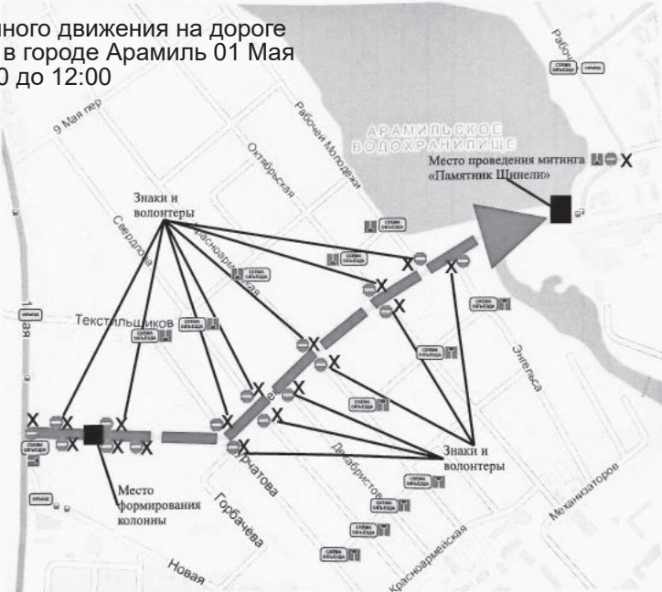
Схема ограниченного движения на дороге по улице Ленина в городе Арамил 01 Мая 2026 года, с 09:30 до 12:00

СХЕМА ОБЪЕЗДА: схема объезда, ОБЪЕЗД: направление объезда, X: волонтеры, знак 3.1 «движение запрещено»