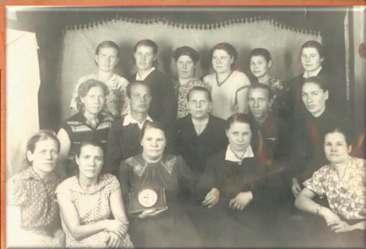
Работники завода №508