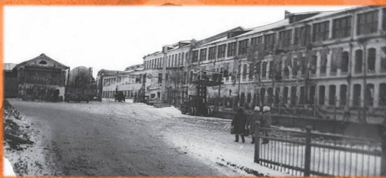
Здание ФЗУ и медпункта АСФ(на фото слева)