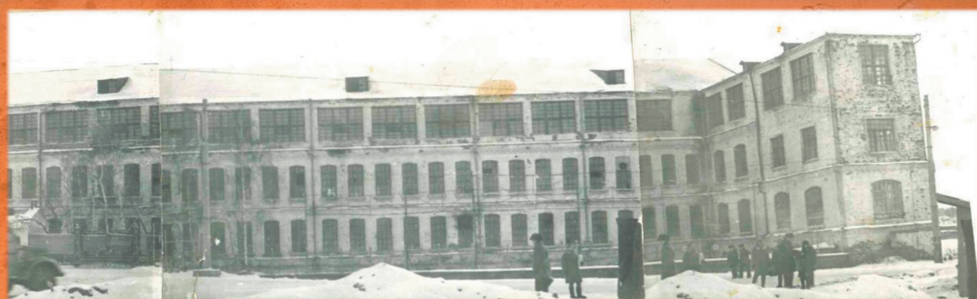
Фото здания АСФ, 1950-е гг