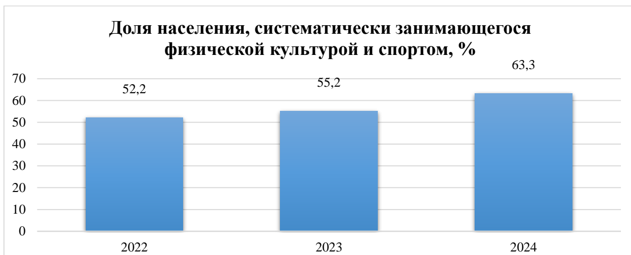
Рисунок 3 – Доля населения, систематически занимающегося физической культурой и спортом на территории Арамильского городского округа